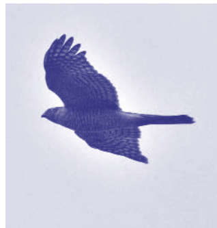
計画地内で確認されたオオタカ

しかし、市の判断は、基準も定めず専門家の意見も聞くことなく庁内所管で行ったものです。現地調査も十分行っておらず、市民や事業者さえ確認した絶滅危惧種とされるオオタカなど貴重種の存在さえ確認していません。非開示にしていた関係資料の一部を質