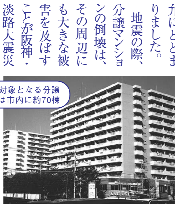
高尾パークハイツ