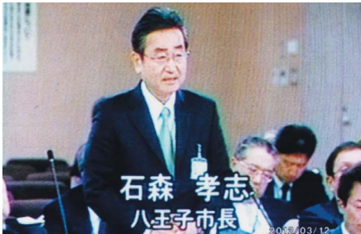
石森 孝志 八王子市長