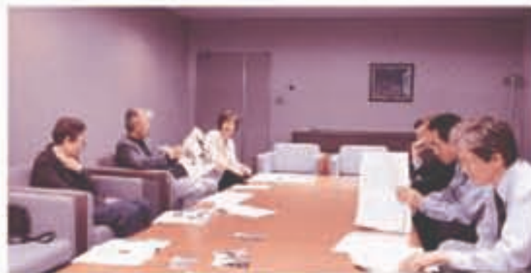
さっそく市に要請しました。(みなみ野にお住まいの皆さんと、4月28日)