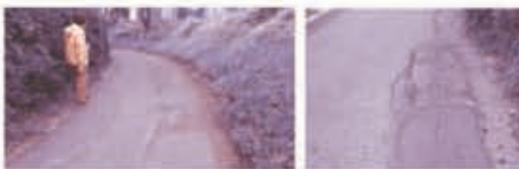
雨が降ったらぐちゃぐちゃです。道路補修を(片倉町)