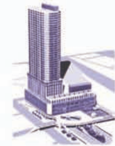
八王子駅南口再開発ビル完成予想図

投入額をたいしたことはない」と言っていました。ところが、とんでもありません。「ミニ市役所」を再開発ビル内に設置する計画についても、市の当初案