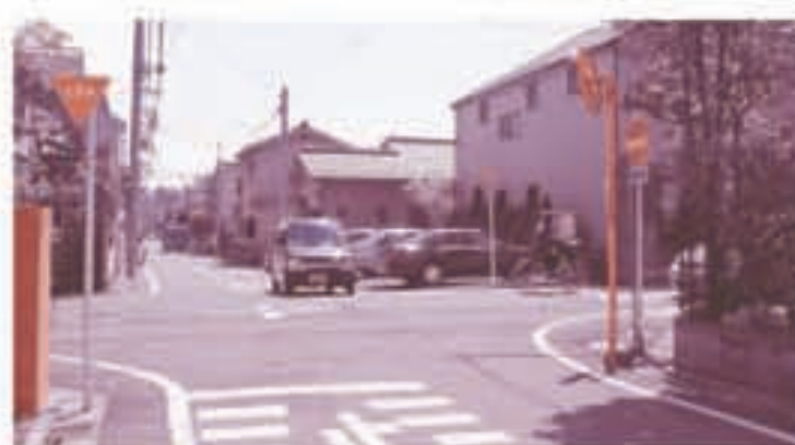
交差点の手前に右折禁止の矢印を(小門町)