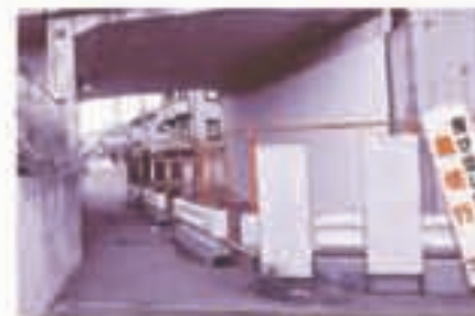
ここが開通するのはいつでしょうか?(打越町)