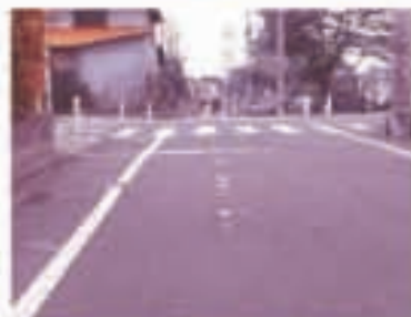
交差点「とまれ」の表示が消えている(片倉町)