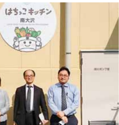
南大沢給食センターを視察する議員団