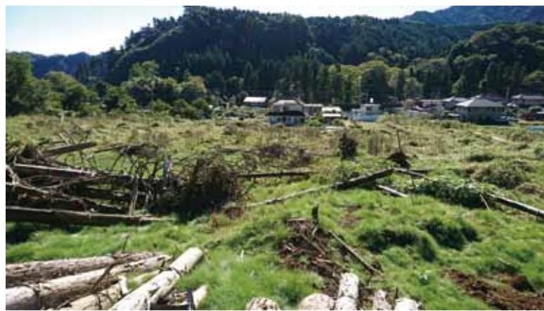
土砂に埋まった畑(恩方佐渡地区)

台風19号被害の復旧対応は、1年がたっても対策が遅れています。恩方大沢地区の河川堤防の決壊や恩方佐渡地区はいまだに土砂に埋まっています。被災住民の声を紹介し、市の支援を求めたところ、市は「支援を行うべき場合の基準をつくる」と表明。党市議団は「常に努力する姿勢が必要だ」と強調しました。