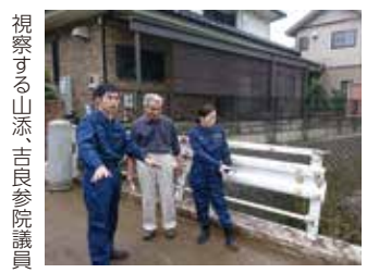
恩方佐戸地区の土砂災害