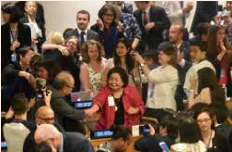
写真は、国連で採択された時のものです(2017年7月)

今年6月の定例会で、市民団体からの要望を受けて共産党市議団が提出した核兵器禁止条約批准を求める意見書が賛成多数で採択されました。条約には現在33か国が批准(50か国で発効)、しかし日本政府は批准していません。意見書採択は大きな意義を持ちます。