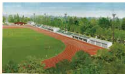
陸上競技場イメージ図(市の資料より)

請願には、共産、立憲民主・市民の会、生活者ネット、諸派(1名)が賛成、自民、公明、市民クラブ(1名は退席)、諸派(2名)が反対し、不採択となりました。